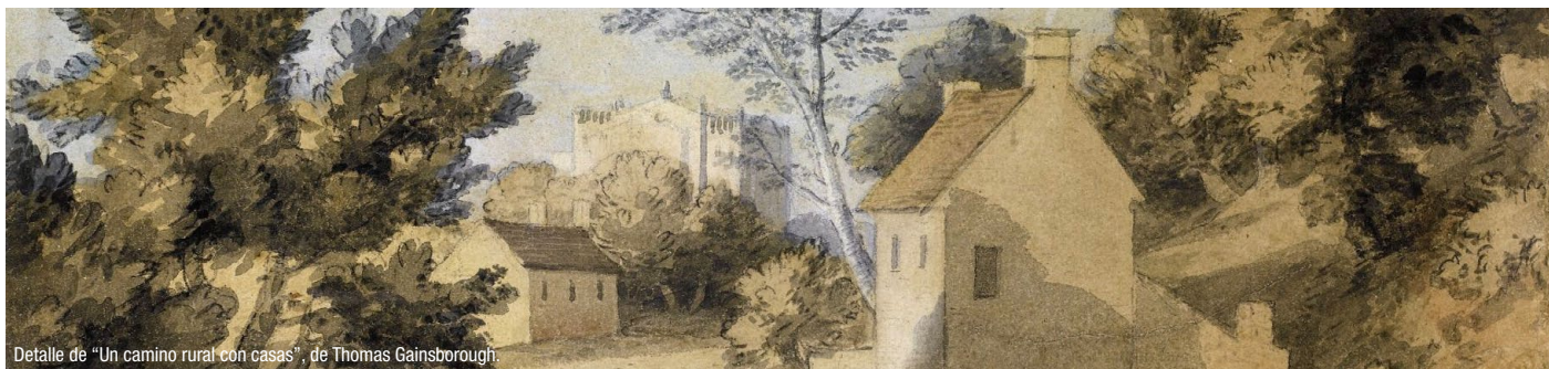
Detalle de "Un camino rural con casas", de Thomas Gainsborough.